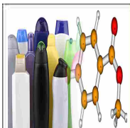
Cosmetica e parabeni: quanto