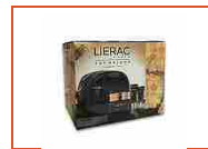
Lierac The Bridge Cofanetto Premium Anti-EtÀ Globale