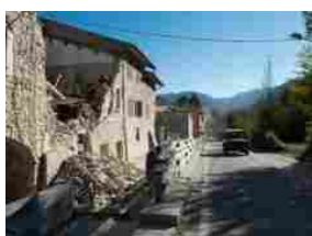
Terremoto, sindaco di Visso: "stanotte abbiamo avuto compagnia..."