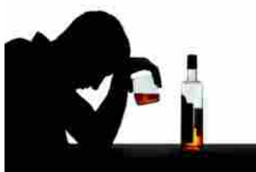
Salute, Toscana: sono quarantenni i maggiori consumatori di alcol