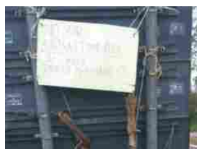
Animali, WWF: in Toscana lupo barbaramente scuoiato e appeso...