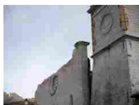
Terremoto: il 50 per cento della basilica di Norcia...