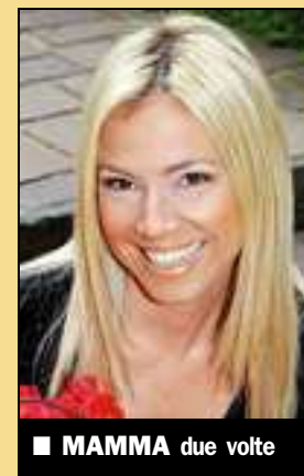
■ MAMMA due volte

“Da Boston a San Marino per i miei figli”