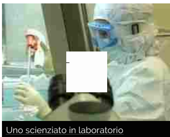
Uno scienziato in laboratorio

sabato 2 luglio 2016 | Da San Marino parte una speranza per rendere la vita meno dolorosa ai malati di diabete e altre patologie. Il Bioscience Institute di San Marino ha sperimentato una cura inedita per trattare le cosiddette 'ferite difficili'